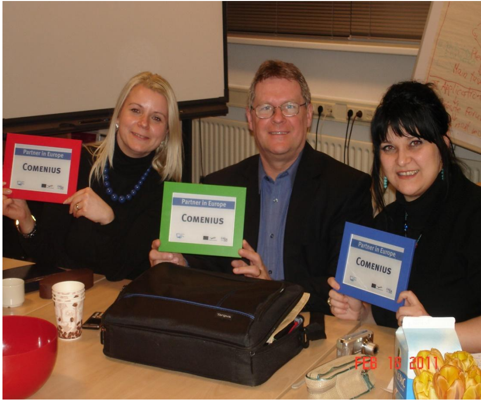
Echipa BaCuLit CCD Arad