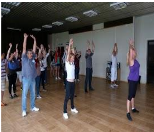
Flash mob dans